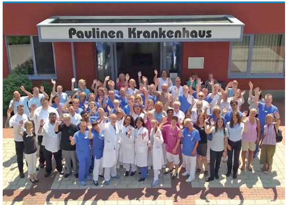
► Das PKH-Team

Wichtig war auch 2018, die Digitalisierung unserer Prozesse, auf die wir immer wieder in den letzten Ausgaben der PaulineNews eingegangen sind, voranzutreiben. Ein wesentlicher Schritt ist uns dadurch gelungen, dass 2018 alle bisher vorhandenen digitalen Patientenunterlagen in ein elektronisches Archiv überführt werden konnten. Damit ist es möglich, die gesetzlich geforderte Speicherfrist für digitale Patientenunterlagen von 30 Jahren zu erfüllen und sämtliche Daten entweder im DICOM-Format (Bilder) oder im PDF/A-Format (Texte) vorzu-