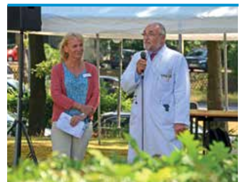
► Die traditionelle Eröffnungsrede der Krankenhausleitung