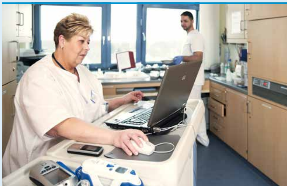
► Bereits heute arbeiten alle Bereiche am Paulinenkrankenhaus mit EDV-gestützter Dokumentation

Im klinischen Bereich wird die Umstellung auf eine papierlose Dokumentation von erhobenen Befunden noch in diesem Jahr abgeschlossen werden können. Für die letzten Module, EKG, Belastungs-EKG, Langzeit-Blutdruckmessung und Lungenfunktionsmessung, wird die Integration in das Krankenhausinformationssystem