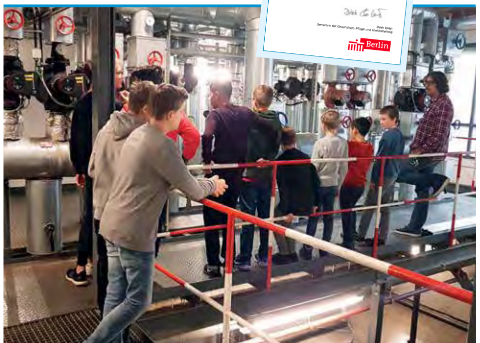
► Technische Anlagen im Paulinenkrankenhaus