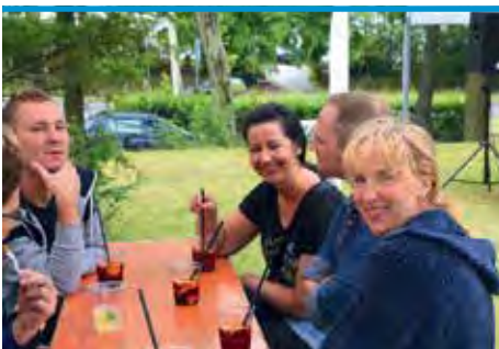
► Sommerfest im Paulinenkrankenhaus

Und natürlich durfte auch nicht die Tombola fehlen. Die Gewinner konnten sich über tolle Preise freuen.