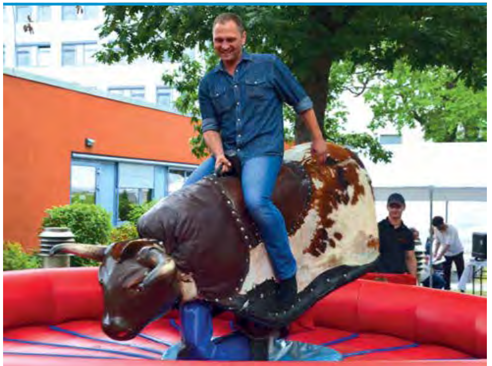
► Der Rodeo-Bulle sorgte für Action und Spaß