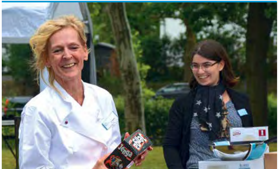
► Tombola auf dem Sommerfest

Ein besonderes Highlight war in diesem Jahr die Siegerehrung des Fotowettbewerbs. An dieser Stelle noch einmal ein herzliches Dankeschön an alle Teilnehmerinnen und Teilnehmer!