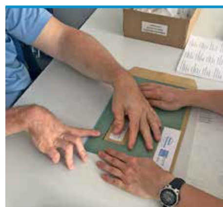
► Die Kuverts mit dem Paulinennewsletter werden mit Adressaufklebern versehen