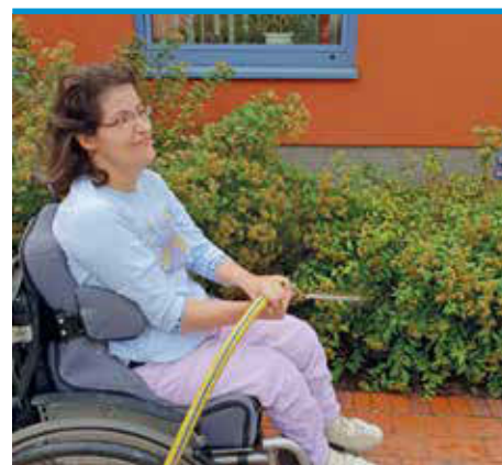
► Frau W. beim Gießen des Blumenbeetes am Paulinenkrankenhaus

Wenn auch Sie an einem gemeinsamen Projekt interessiert sind und in unserem „Kiez“ angesiedelt sind (rund um die Kranzallee in Charlottenburg), dann lassen Sie uns gemeinsam überlegen, wie wir Sie unterstützen können!