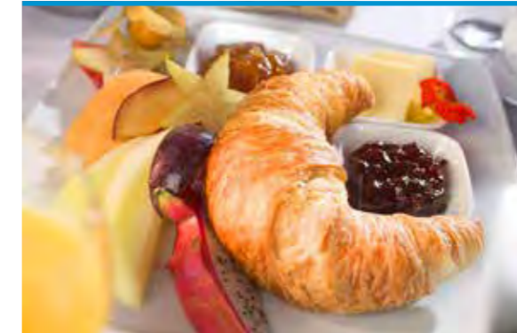
► Kleines süßes Frühstück (ofenfrisches Buttercroissant, serviert mit zweierlei Marmelade, frischem Obst und Butter)

Wie möchte das Küchenteam den Aufenthalt im Paulinenkrankenhaus kulinarisch verbessern?