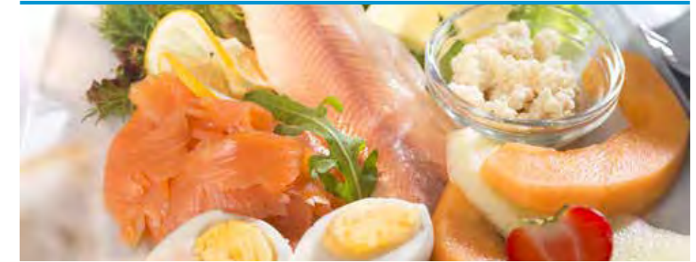
► Fischfrühstück (verschieden geräucherte Fische, serviert mit Meerrettich, gekochtem Ei, frischem Obst und einer Auswahl ofenfrischer Brötchen)

ihre tägliche Pause freuen und durch schmackhafte Speisen und Snacks neue Kraft tanken. Patientenangehörige sollen wissen, dass auch wir in unserem Bereich unser Bestmögliches zur Gesundheit ihrer Angehörigen beitragen. Weiterhin möchten wir auch unseren direkten Nachbarn stets ein freundlicher Gastgeber sein.