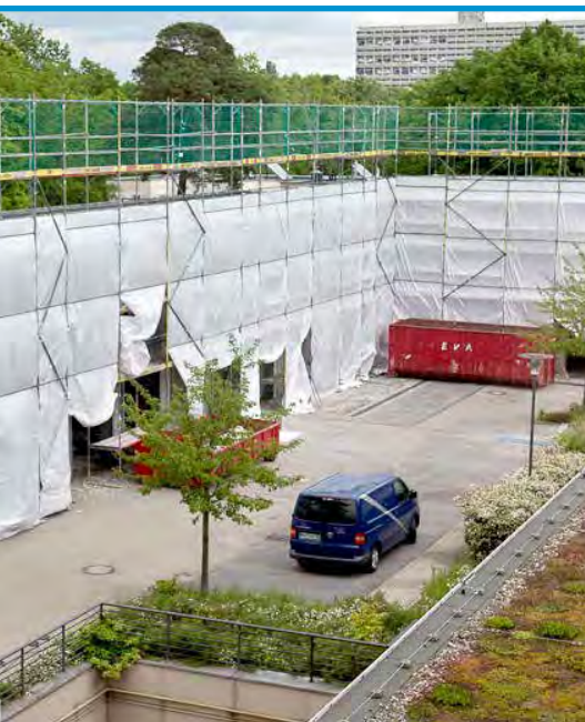
► Eingerüsteter Bestand

Das Architektenbüro db-a erhielt den Auftrag, ein neues Konzept zur Realisierung dieses Projektes zu entwickeln. Unter Beteiligung von Fachingenieurbüros wurde eine genehmigungsfähige Planung für insgesamt 21 Appartements erarbeitet.