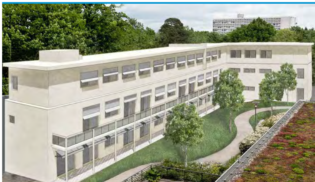
► Geplante Ausführung

Berlin, Juni 2014 die buchholz-architekten J. Buchholz