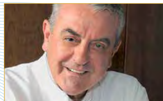
Freunde und Mitarbeiter zur „Pauline“ ▶ S. 5