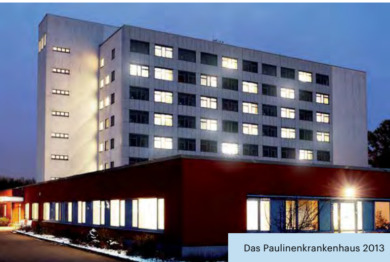
Das Paulinenkrankenhaus 2013

Das Paulinenkrankenhaus feiert seinen 100. Geburtstag. Diesem Ereignis ist die Sonderausgabe der Pauline News gewidmet. Sie erinnert an Menschen, die das Haus geprägt haben und richtet sich an diejenigen, die die Zukunft der „Pauline“ gestalten werden. Eine ausführliche Chronik gibt es auf der neuen Website und auf einem Jubiläumsstück. Einfach war es nicht, aus dem umfangreichen Material der letzten 100 Jahre eine repräsentative Auswahl zu treffen. Eine Ausstellung im Foyer erinnert an interessante Ereignisse aus der Historie der „Pauline“. In dieser Ausgabe werden sich verschiedene Persönlichkeiten zum Jubiläum äußern, zu ihren Erinnerungen und zu ihren Erwartungen für die kommenden Jahre. Auf den nächsten Seiten kann der Leser auf Entdeckungstour gehen. Er wird interessante Details zu den Geschehnissen der letzten Jahrzehnte erfahren. Und natürlich wollen wir uns bedanken: bei all unseren Partnern, die uns geholfen haben, aus dem Jubiläum ein ganz besonderes Ereignis zu machen.