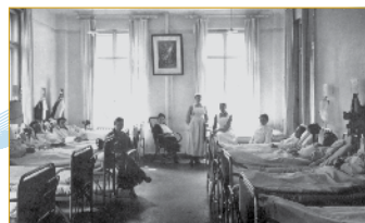
Die spannende Geschichte des Hauses ▶ S. 4