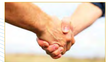
Mit wem wir erfolgreich kooperieren ▶ S. 8